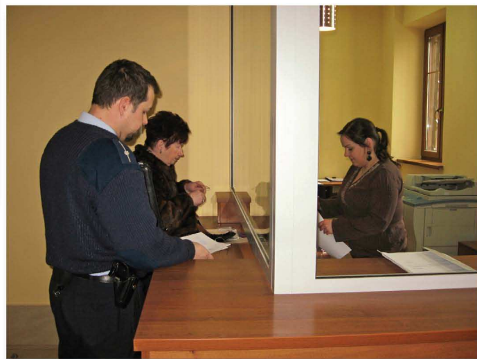
Nowoczesny Punkt Obsługi Obywatela został uruchomiony w marcu.