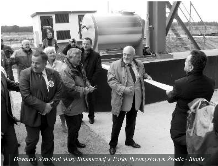
Otwarcie Wytwórni Masy Bitumicznej w Parku Przemysłowym Źródła - Błonie