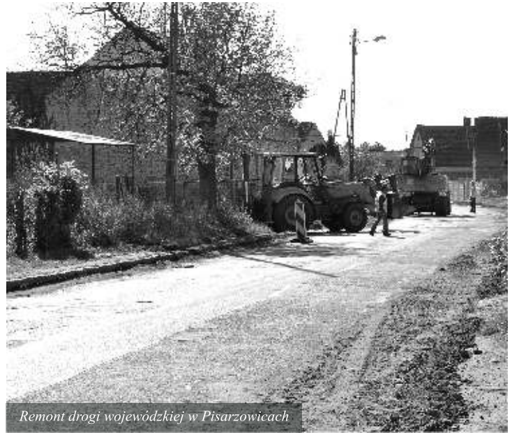
Remont drogi wojewódzkiej w Pisarzowicach

Miękinia, relacji Wilkszyn – Brzezinka Średzka. Remont prowadzony jest przez firmę Eurovia Polska, która wygrała przetarg przeprowadzony przez Dolnośląską Służbę Dróg i Kolei. Całkowity koszt remontu wynosi 1,8 miliona zł. Samorząd Województwa przeznaczy z własnych środków 1,5 miliona zł, natomiast Gmina Miękinia, zgodnie z zapisami porozumienia, kwotę 300 tys. zł.