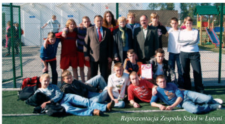
Reprezentacja Zespołu Szkół w Lutyni

W turnieju uczestniczyły drużyny z miękińskich szkół podstawowych i gimnazjalnych oraz goście: szkoła podstawowa z Kryniczna i Rakoszyc.