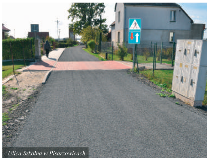
Ulica Szkolna w Pisarzowicach

Wytypowane drogi, do powierzchniowego utrwalenia, miały odpowiednią podbudowę pozwalającą na zastosowanie wyżej wskazanej technologii. W roku 2010 kontynuowane będą działania związane z remontem dróg w technologii powierzchniowego utrwalenia, dla dróg posiadających właściwą podbudowę. W kolejnych latach budżetowych drogi nieposiadające właściwej konstrukcji (drogi wykonane ze szlaki) zostaną wyremontowane w technologii stabilizacji chemicznej. Należy zaznaczyć, iż gmina przeznacza około 20 % ogółu wydatków budżetowych na remonty dróg.