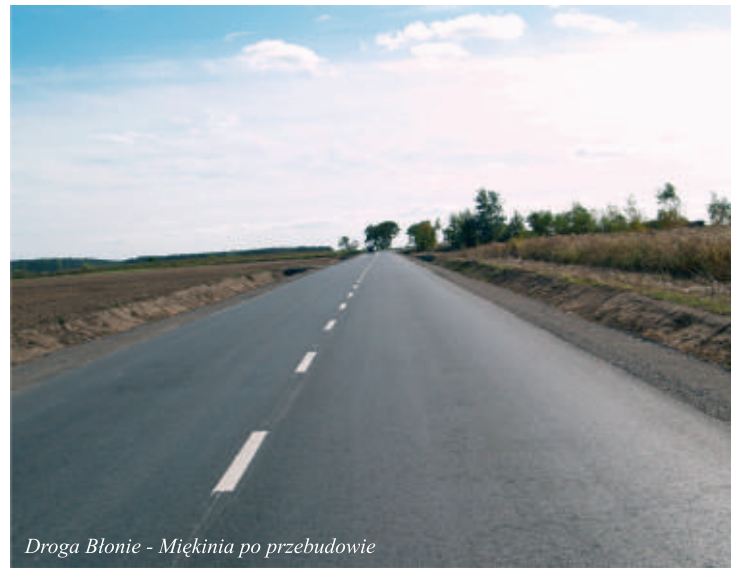
Droga Błonie - Miękinia po przebudowie

Wszystkim osobom korzystającym z nowej drogi zwracamy uwagę na zmianę organizacji ruchu w miejscowości Miękinia.