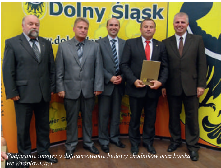
Podpisanie umowy o dofinansowanie budowy chodników oraz boiska we Wróblowicach