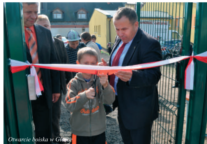
Otwarcie boiska w Głosce

Boisko w Głosce, to już czwarty obiekt sportowy, po boisku i hali w Miękini oraz kompleksie boisk sportowych ORLIK 2012