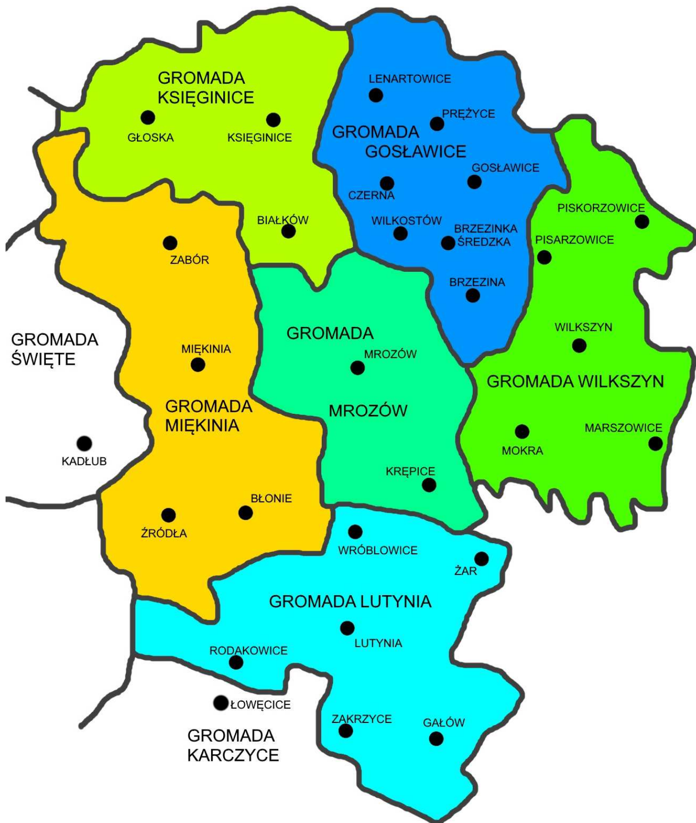
Podział na gromady z 1955 roku (opracowanie własne)