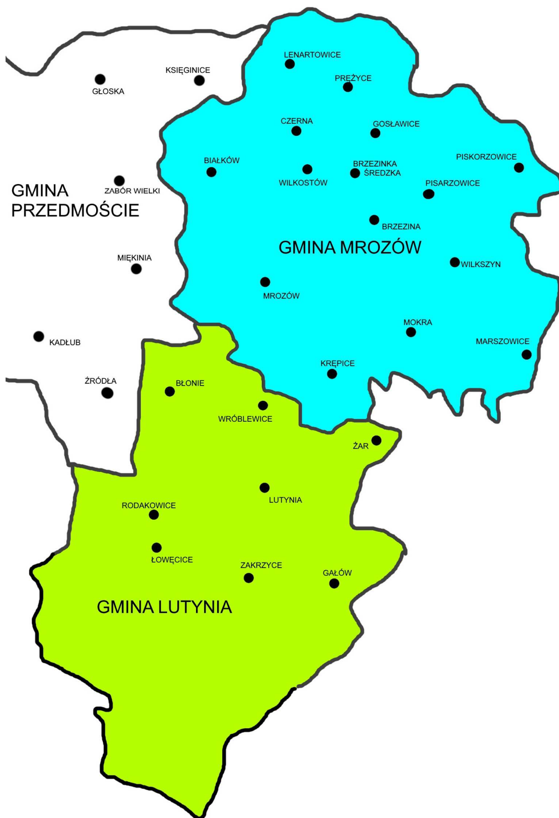
Podział na gminy z przełomu lat 40. i 50. XX wieku (opracowanie własne)