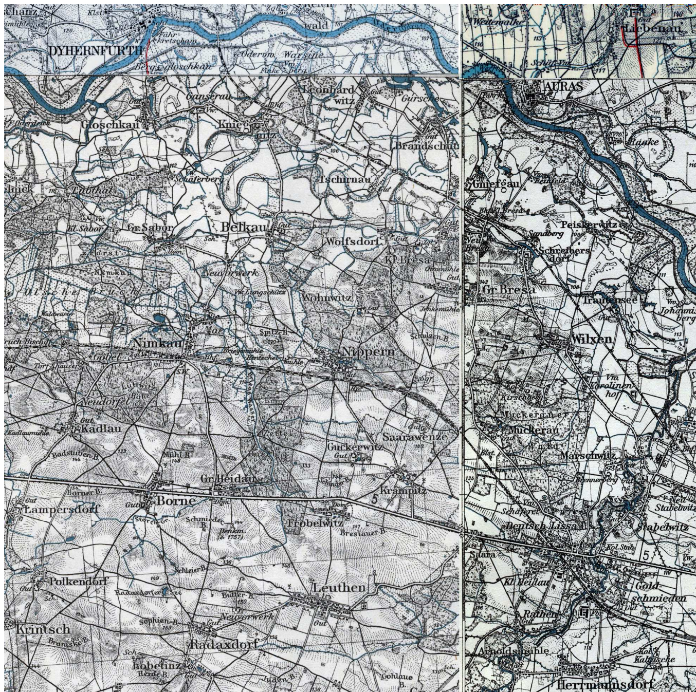
Fragment polskiej mapy z lat 30. XX wieku przedstawiającej okolice Międzybórz w granicach państwa niemieckiego